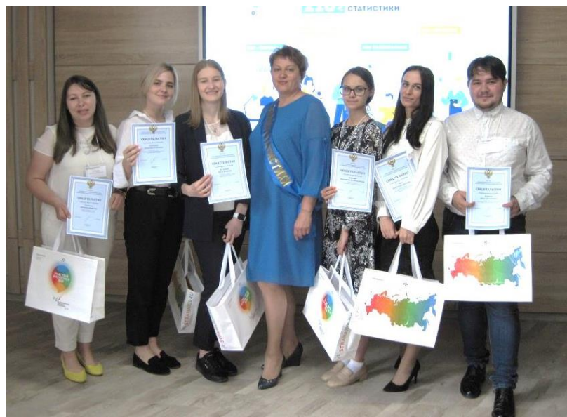
церемония посвящения в статистики