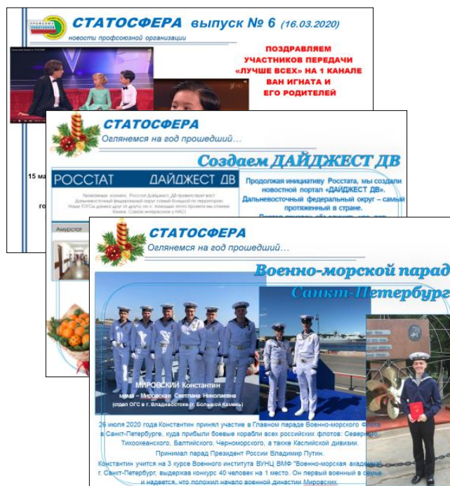
медиа-проект «Статосфера» - новая жизнь