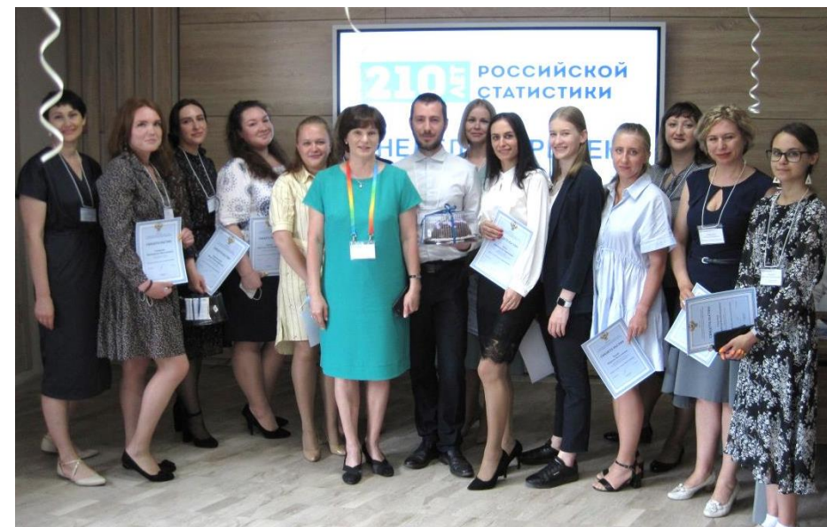
акция «Неделя перемен»: рядовые специалисты на неделю стали начальниками своих отделов